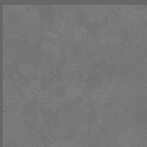
103 - Bronx