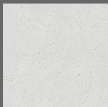
101 - Soho