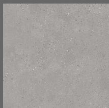
102 - Queens