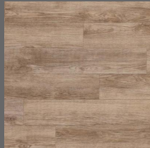
009 - Oak