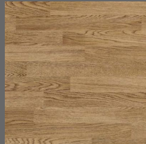
010 - Deckwood