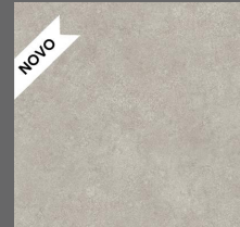
013 - Urban Grey