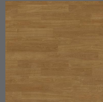
012 - Pine