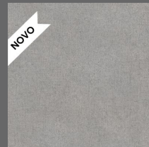
016 - Moon