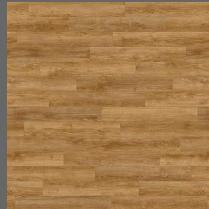
011 - Ebony