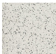
204 - Frosty Glen - LRV-65.3