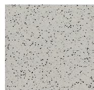
201 - Thunderstorm - LRV-46.3