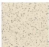
202 - Warm Haze - LRV-65.4