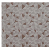
ABC - 002 Rainbow