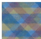
Textile - 006 Crayon