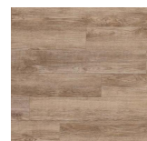
Durable - 009 Oak