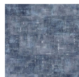
Textile - 008 Deep Sea Navy