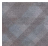
Textile - 005 Mint Choco