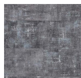
Textile - 007 Cloudy Grey