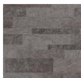
Stone - 003 Khaki Sand