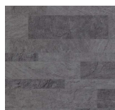
Stone - 004 Pure Steel