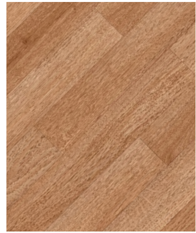
Classical Oak / Natural