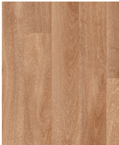
French Oak / Medium Beige