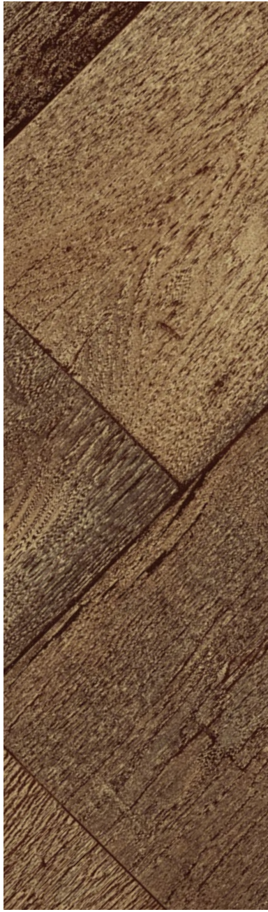
Flanders / Dark Brown