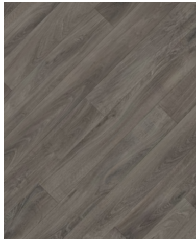
French Oak / Dark Grey