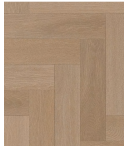
Ancares Herringbone / Limed