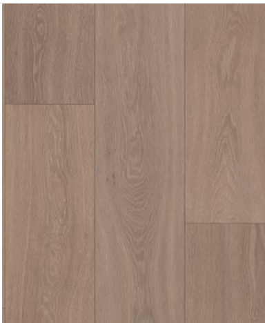
Ancares Oak Plank