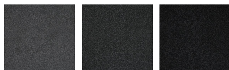
409 - Park