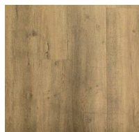
203 - K171912 - Renard