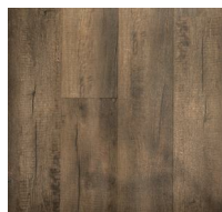
202 - K177502 - Porter