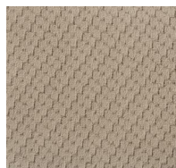
104 - Decor