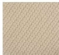
103 - Art