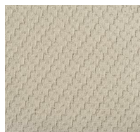
102 - Modern