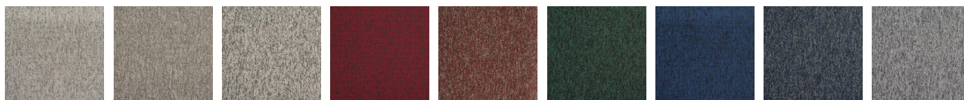
400 - Pólux