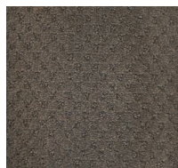
006 - Reflection