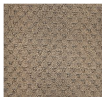
005 - Studio Taupe