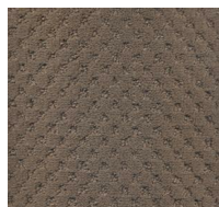
007 - Yearling